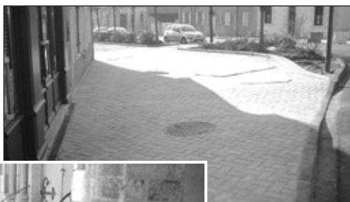
Emplacement réalisé en pavés de porphyre.

Afin de préserver le bon état de ces trottoirs, il vous est demandé de ne pas stationner avec un véhicule sur le béton désactivé, d'ailleurs des quilles seront installées très prochainement pour limiter l'incivilité de certains conducteurs.