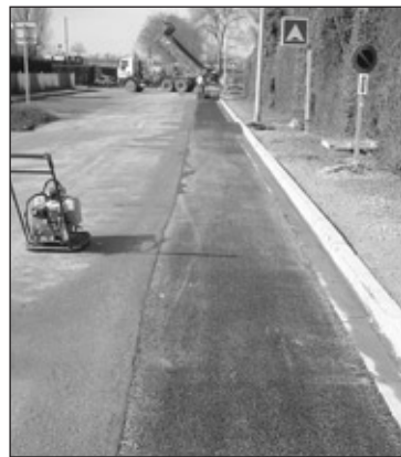
Extension de l'assainissement chemin du Tronçais pour évacuer les eaux usées des sanitaires du stade du Chambon.

Cette période humide a reporté le travail de terrassement pour début Mars. Par contre l'assainissement de la rue du Petit Gibus jusqu'au gymnase s'est effectué pendant les vacances scolaires de février.