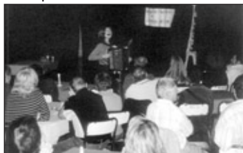
Lilybulle et son Gaston d'accordéon.

Cette première soirée de la saison 2006-2007 a donné le ton.