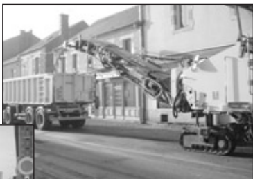
Rabotage de la traverse du bourg par l'entreprise APPIA.

La route, même rétrécie, depuis la mise en place du