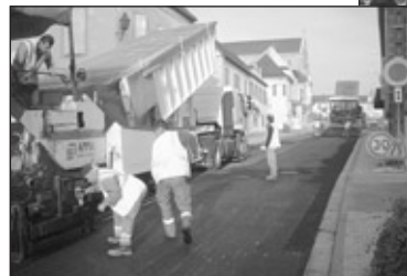
Mise en bitume de la RN 79.

La largeur des trottoirs et des parkings se dessine tout doucement.